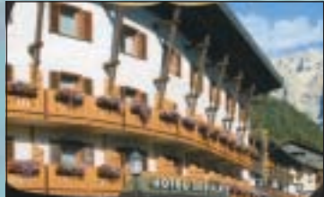
(Hotel Olympia z.o.z.)

Dit zijn in Wolkenstein uitstekende hotels. Gelegen in het dorp op loopafstand van de lift. Hotel Stella is zelfs gelegen direct aan de lift van de Sella Ronda. Uitstekende keuken,